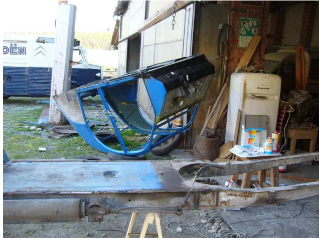
Con precisione chirurgica si cerca di smembrare il marcio