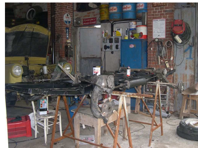
E rimontaggio degli assali