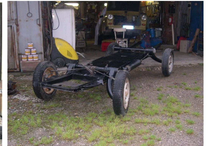
Ed infine girto panoramico e rimessaggio che fa presagire quali saranno i prossimi lavori...