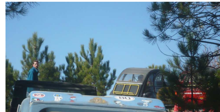
tutto a posto 😊

.... tutto si sistemò al meglio e il gruppo poté riaggregarsi sotto la supervisione di cbaz 📹