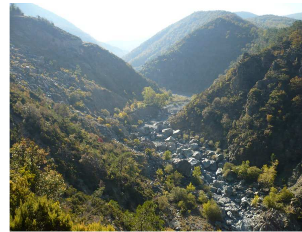
il torrente Piota