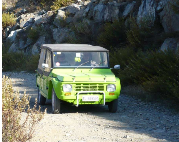
auto mimetizzata 🤖

👤 dobbiamo bloccarli e par far ciò ci divideremo in diversi gruppetti.