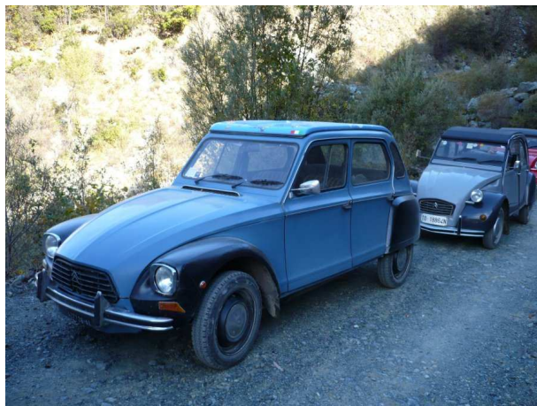
il capobranco 🐶

Acdyane .... vedete che avevo ragione, la mehari per questi scenari desertici è l'ideale, fidatevi di me, ricordo che a Kabul ci trovammo in mezzo a dei predoni..... BLAH👤