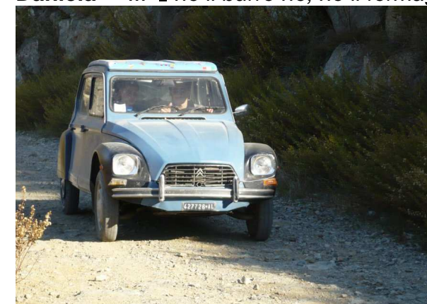
erano partiti terzi... finirono in fondo