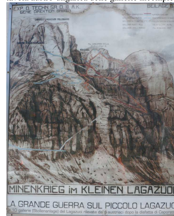
tavola austro-ungarica delle gallerie incompleta