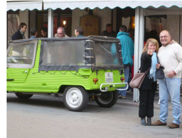
sorridi fai finta di nulla 😊

così facendo tra il 1916 e '17 sul Piccolo Lagazuoi scoppiarono cinque mine modificando radicalmente alcuni tratti della montagna 🤖 e tutto questo senza aver nessun vantaggio per i due eserciti, alla fine dopo la disfatta di Caporetto dell'ottobre 1917 l'esercito italiano abbandonava anche queste posizioni per trincerarsi lungo la famosa linea difensiva del Piave.